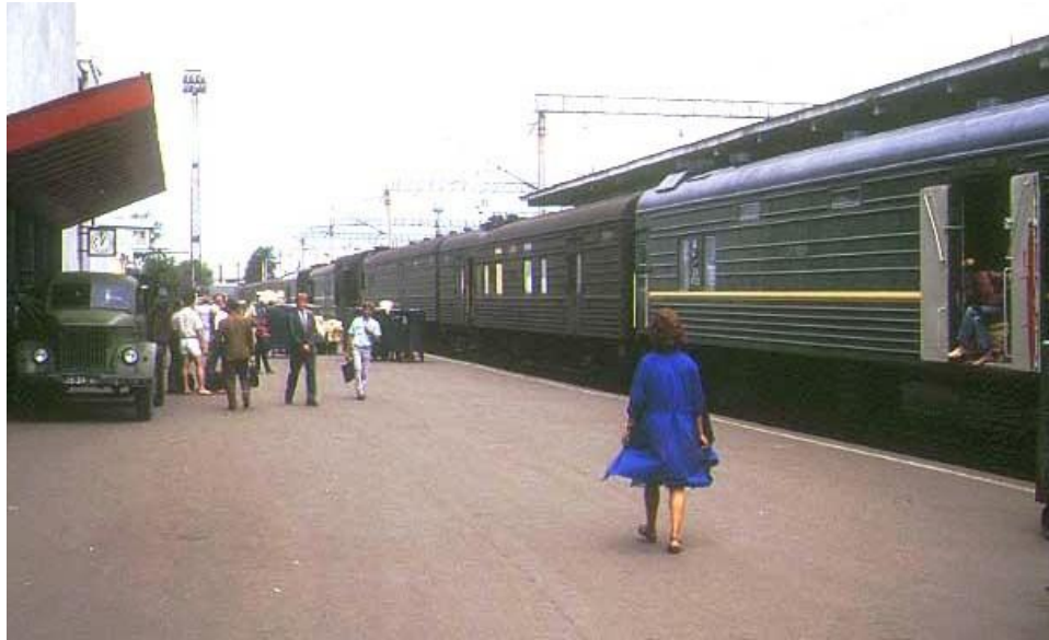
Улан-Удэ, 1980-е годы.