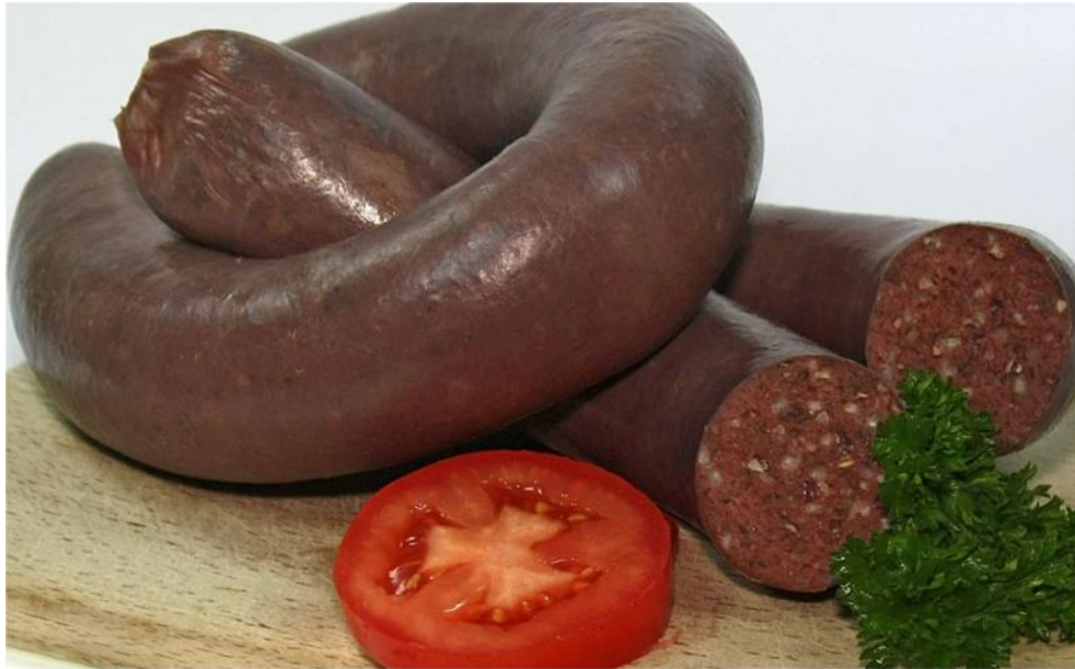
Правильная кровяная колбаса. По материалам Интернета.