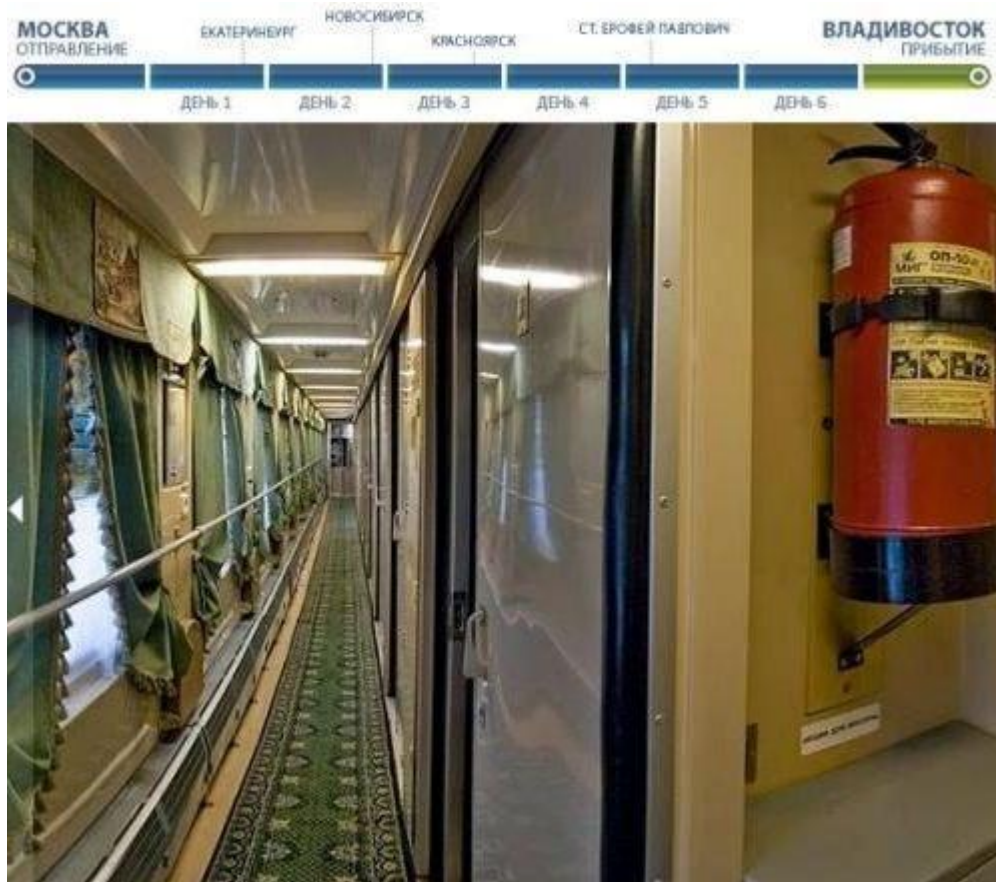
Поезд Москва-Владивосток, 2000-е годы.