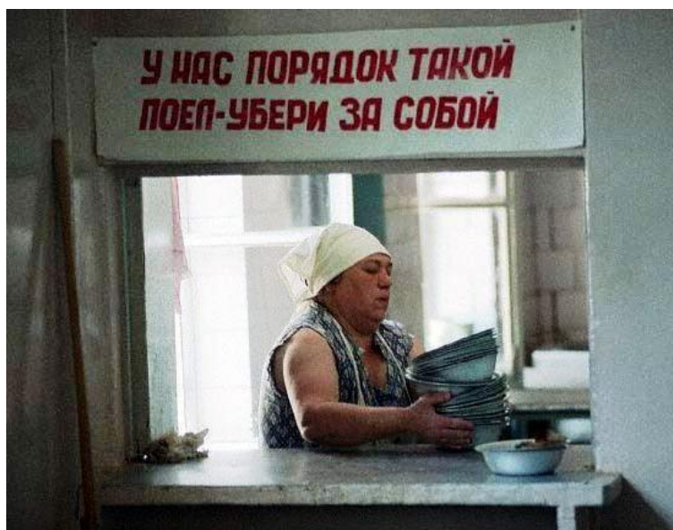
Советская столовая. По материалам Интернета.