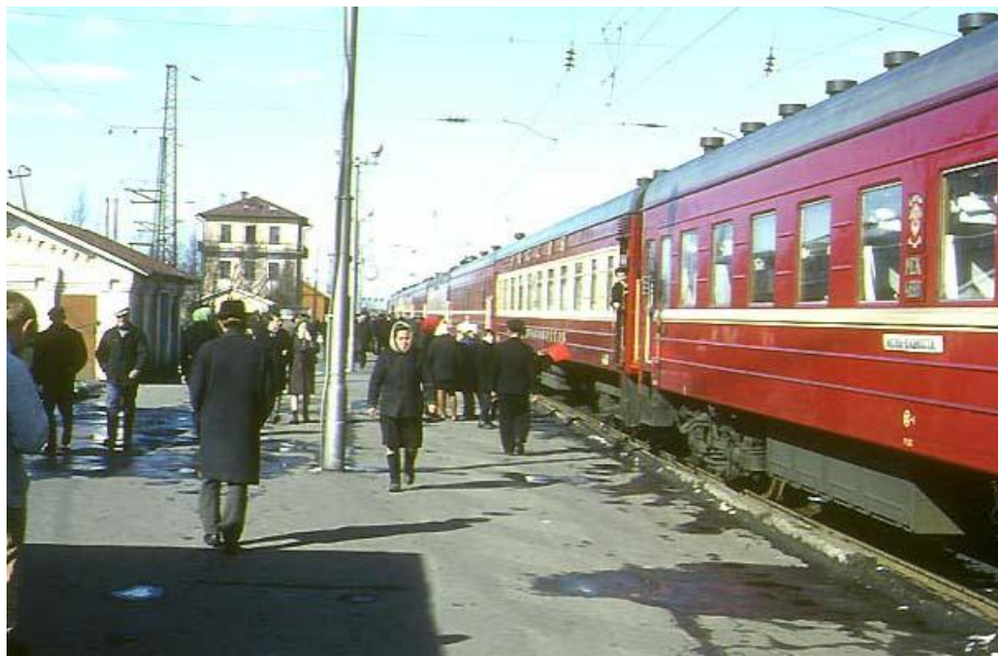
Поезд Москва-Владивосток, Улан-Удэ, 1980-е годы.