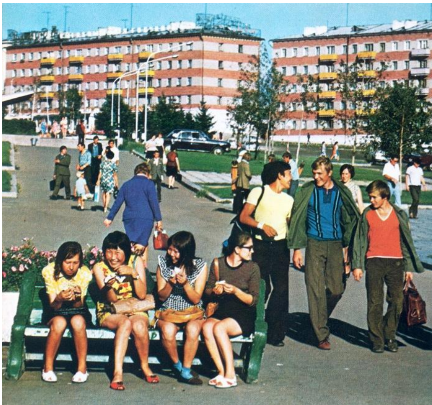
Улан-Удэ. 1980-е годы.