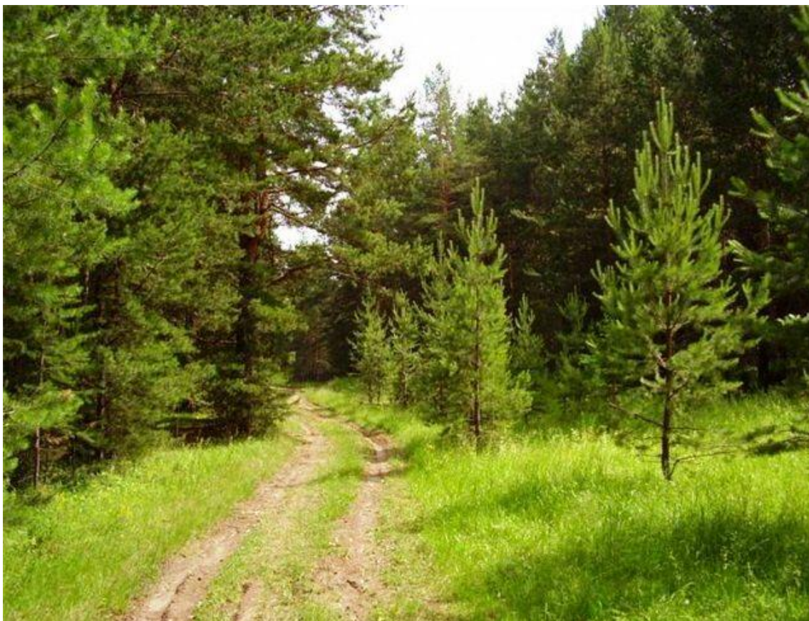
Лес в Бурятии. По материалам Интернета.