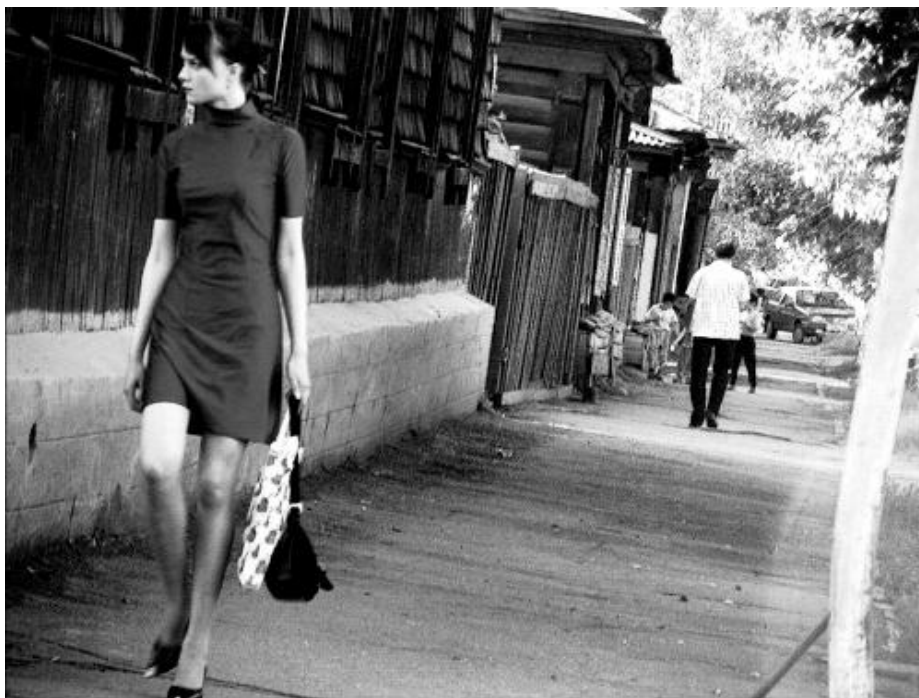
Улан-Удэ. 2000-е годы.