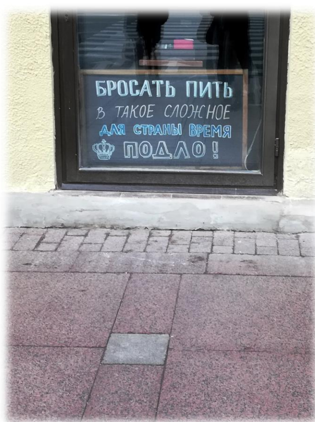
Надпись на окне бара.