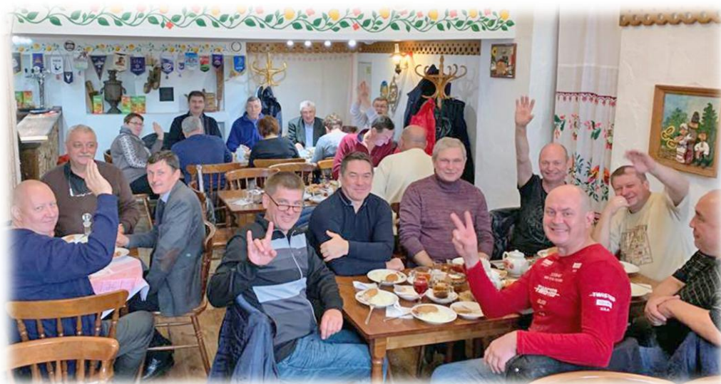
Обед в Стрельне.

Жаль, что Вы не с нами, а на чужбине! Как вам не тоскливо, я не понимаю? Но это ваше дело! В любом случае мы вас ждем и надеемся на встречу!