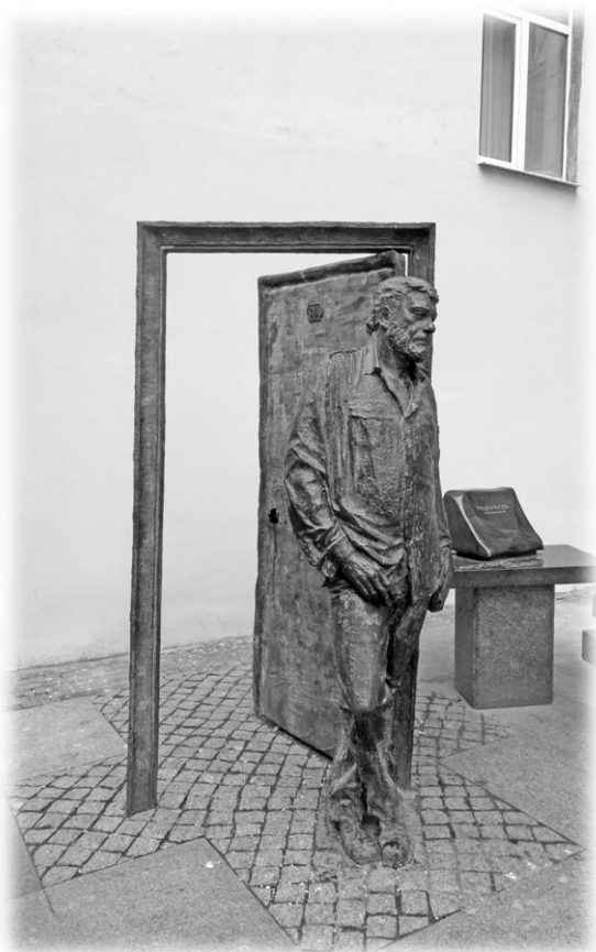
Довлатов на Рубенштейна.