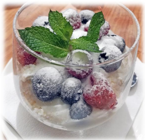
Творог с ягодами