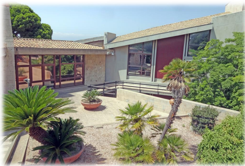
Кальяри, музейный комплекс

своими нечистотами море. Несанкционированные сбросы канализации, отсутствие ливневки, я уже молчу об очистных сооружениях, которые если и есть, то явно не могут справиться с таким количеством фекалий, сделали морскую прибрежную среду не годной для человека и животного мира. Вообще, то, что я видел в Адлере иначе, как преступлением назвать не могу! Остается удивляться, а где прокуратура, куда смотрит санитарный врач, и как губернатор Краснодарского края может вообще смотреть в глаза людям! Ко всему сказанному про Адлер (читай в целом про «наш» Юг) необходимо добавить, что там пагубная для нормального взрослого человека, а для детей в особенности не могу вымолвить, но иначе не скажешь – культурная среда. Культуры нет! На пляже раздаётся похабная попса, годная лишь для «кобелирующих личностей» и «откинувшихся с зоны», массовики-затейники не стыдясь затевают на пляже пошлые конкурсы с подвыпившими отдыхающими, на улицах та же «культура». Впечатление такое, что оказался на большом, затянувшимся дне ВДВ. С детьми, с любимыми и близкими в Адлер ехать не надо! Простите за длинное лирическое отступление! Хотелось просто, чтобы читатель прочувствовал разницу!