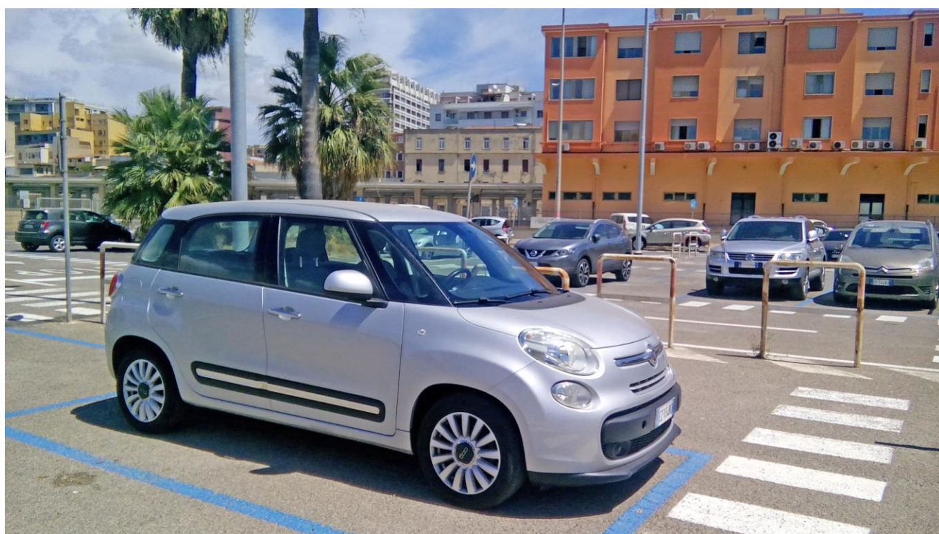
Наш FIAT 500L на парковке в Кальяри

Адрес парковки в Кальяри: Via Sassari 20