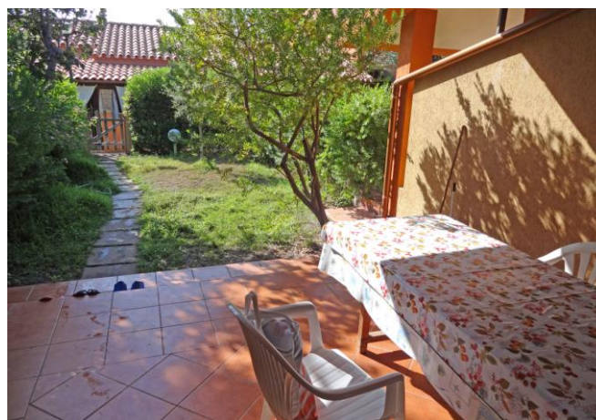
Зеленая зона и терраса апартамента