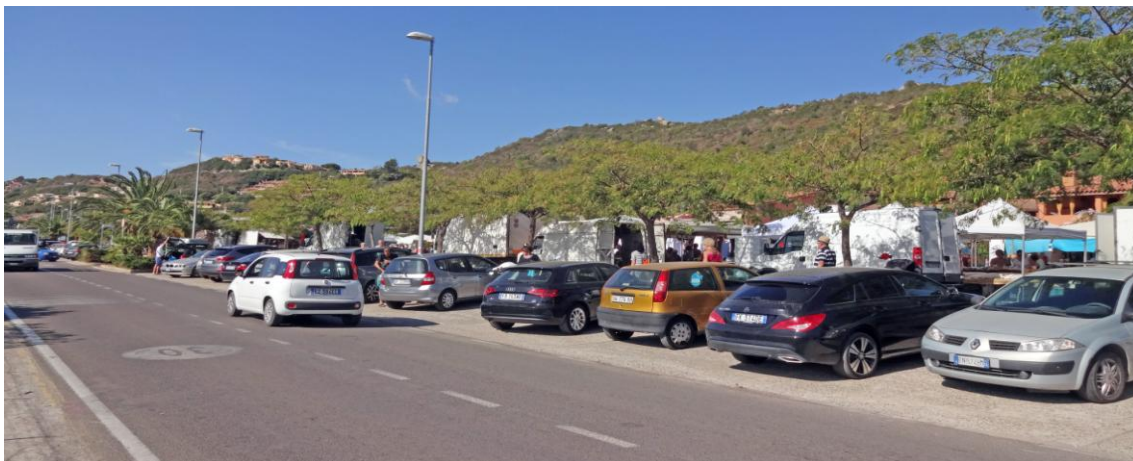
Ярмарка на Via Ichnusa в Коста Рей

одна за другой. В первой комнате кухонный уголок. Между комнатами совмещенный санузел. Вторая комната имеет выход на открытую хозяйственную зону, за которой изгородь, тротуар и автомобильная дорога – улица Via Ichnusa.