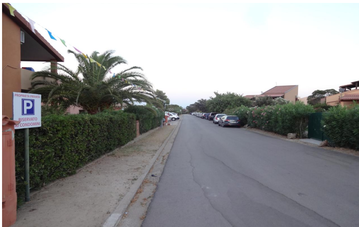
Наша улица Via delle Agavi

Коста Рей это курортный городок, где основная масса отдыхающих итальянцы, многие из которых живут в собственных апартаментах. Другая многочисленная национальная группа – немцы, за ними следуют французы и чехи. Русская речь иногда слышится, но все-таки тонет в бурном море итальянского многоголосья. Коста Рей место, где многое сделано правильно в смысле организации неспешного, комфортного семейного отдыха. В городе нет домов выше двух этажей. Даже несколько отелей не выделяются этажностью из общей массы зданий. Парковочные места точно рассчитаны на количество апартаментов. Мы тоже ставили свой FIAT на асфальтовый прямоугольник с номером нашего апартамента! У отелей собственные парковки.