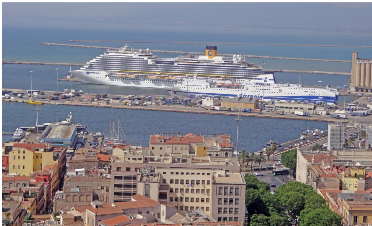
Вид на порт из Кастелло

Пропустив три года, мы вновь вернулись на Сардинию. Отдых на этом чудесном острове особенный. Небольшой остров, окруженный теплыми морскими водами, после шумной Москвы кажется настоящим раем.