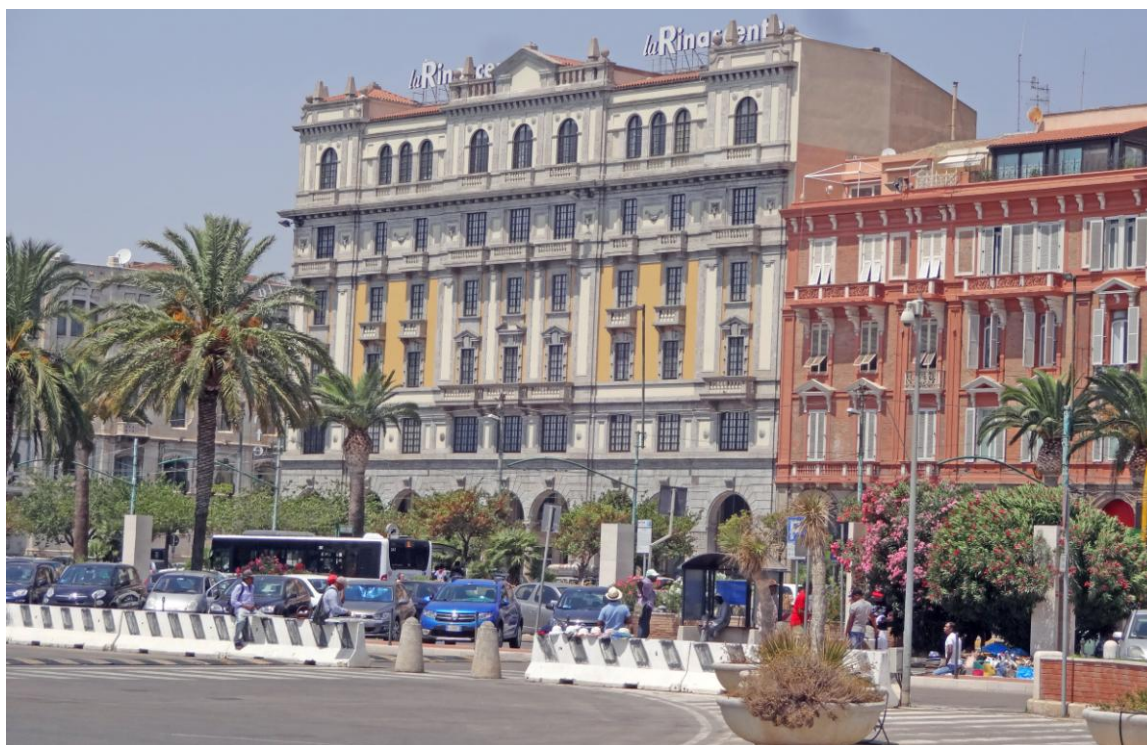
Универмаг La Rinascente (Возрождение) на Via Roma

В Кальяри прекрасная набережная, вдоль которой покачивается на волнах множество красивейших, богатых яхт. Причаливают и морские паромы и даже круизные лайнеры. Набережная тянется вдоль всей Via Roma, где расположены главные дорогие магазины города. Советую не бегать из магазина в магазин а идти сразу в La Rinascente, крупнейший универмаг Кальяри – там есть все!