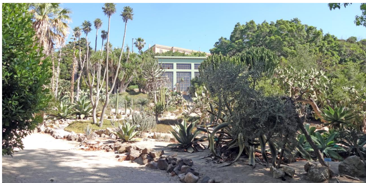
Ботанический сад на Via Sant Ignazio da Laconi

городским улицам, каждая из которых по-своему интересна. Для тех, кто, как и мы занимается творчеством, сообщу, что на улице Regina Elena в районе Бастиона Сан-Реми есть отличный магазин художественных и канцелярских принадлежностей – мы всегда покупаем здесь замечательные акварельные краски, пастель и тп. В этом же здании расположен итальянский ресторан, о котором хотелось бы сказать несколько слов. Мы множество раз проходили мимо этого ресторана (скорее траптории) и каждый раз что-то удерживало нас зайти. У входа неизменно дежурит стрик с характерной внешностью, а-ля мафия: рубашка на выпуск, очки с толстыми линзами в роговой оправе. За столиком на улице перед входом три, четыре подобных типажа, потягивающие кофе и ведущие громкий, как принято у итальянцев разговор. На протяжении всех наших поездок в Кальяри в разные годы мы всегда наблюдали эту картину, проходя мимо ресторана, так как всегда посещали художественный магазин. И вот в четвертую поездку, мы все-таки зашли.